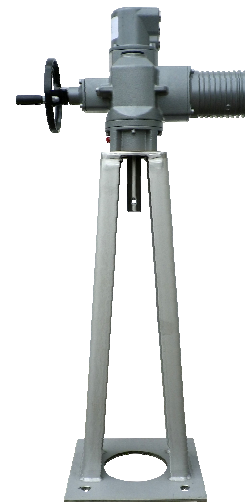
Einbausituation mit Schieber C20-Serie